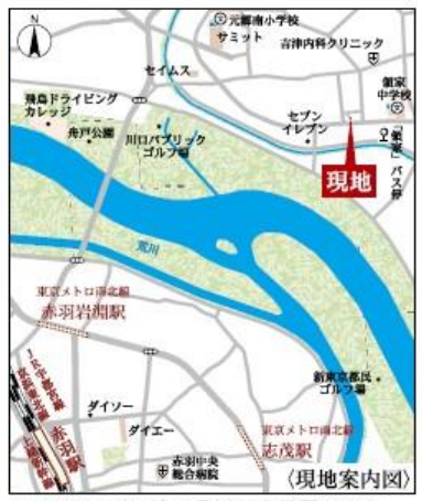
Car navigation 埼玉県川口市元郷3-20-3

[物件概要] 所在地/埼玉県川口市元郷3-1075-22(地番)・埼玉県川口市元郷3丁目20-3(住居表示) 交通/京浜東北線「赤羽」駅バス17分「領家」徒歩4分土地権利/所有権口地目/宅地口用途地域/準工業地域口都市計画/市街化区域口間取り/4LDK口建物構造/木造在来軸組工法3階建(900モジュール) 口総戸数/1棟口販売戸数/1棟口建ぺい率/60%口容積率/200%口現況/建築中口完成予定/2024年6月上旬口引渡し予定/2024年6月上旬口設備/東京電力・都市ガス・公営水道・下水道・ネット・照明・調音機・カーテンレール・防水パン・カーポートはオプションとなります。*宅地内に電柱及び支線が入る場合があります。*司法書士は、当社指定になります。*図面と現況に相違がある場合は現況優先とします。*工事中の場合においては安全のためヘルメットの着用を完成現場においてはスリッパに履き替えてくださるようお願い致します。*広告有効期限/2024年3月31日