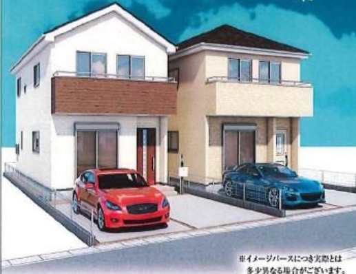
※イメージベースにつき実際とは多少異なる場合がございます。

JR京浜東北線 「蕨」駅バス15分 (約3,470m) 「鹿島」停歩1分 JR京浜東北線 「蕨」駅 徒歩44分(約3,470m)