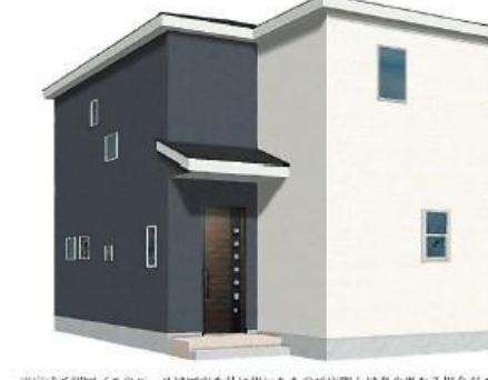
※完成予想図/このハースは河川を基に描いたもので実際とは多少異なる場合がございます。

物件番号 37D8-F970 | 情報公開日 2024年06月25日 | 広告有効期限 2024年07月10日 | 仲介手数料無料+期間限定キャンペーン実施中!