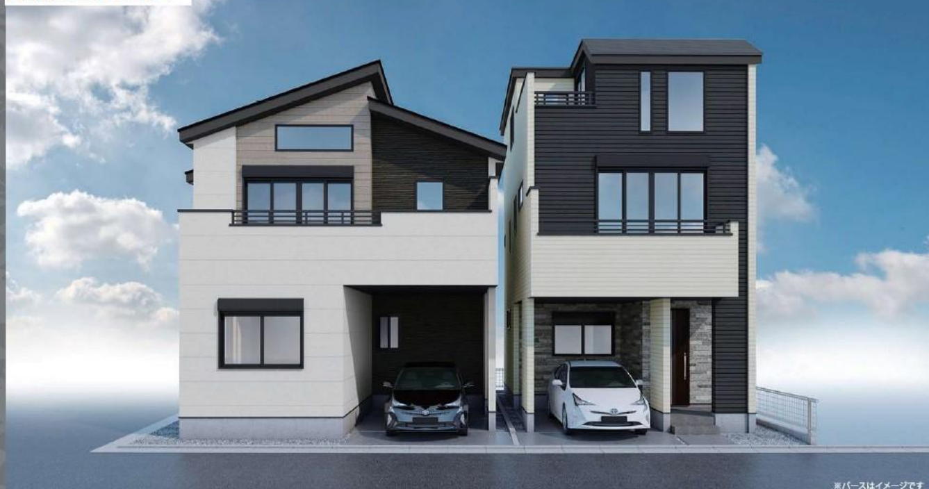
※パースはイメージです