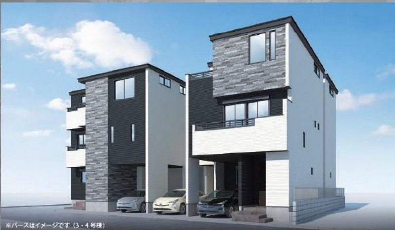
※パースはイメージです。(3・4号棟)