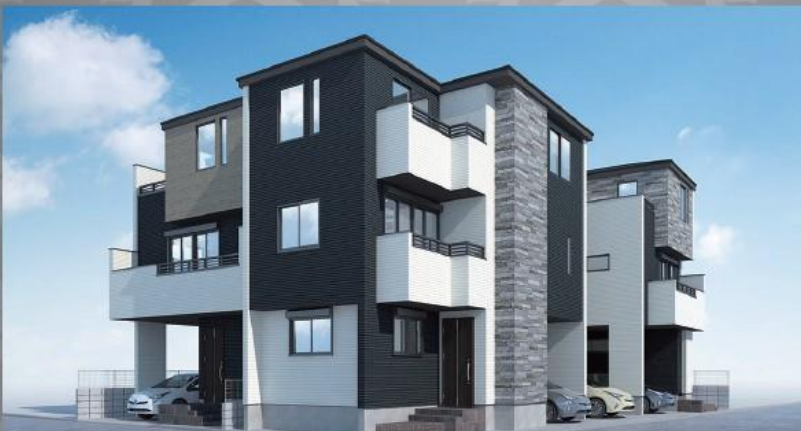
※パースはイメージです。(1・2号棟)