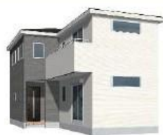
2階全居室2面採光・収納完備♪

1号棟 2SLDK ◆土地面積:96.36㎡ ◆建物面積:98.82㎡ ◆セットバック:採納予定 ◆道路:北東側3.5m公道 ◆建築確認番号:第23UD11W建06590号 価格 3,380万円(税込)