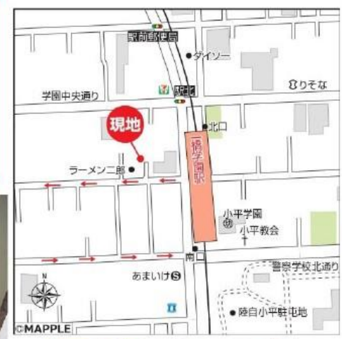
カーナビ入力 小平市学園西町 2-13-3 付近