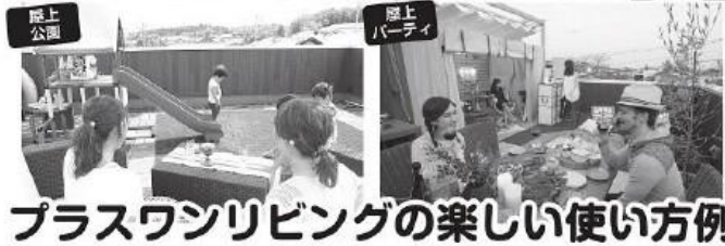
プラスワンリビングの楽しい使い方例