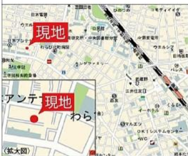
カーナビ 埼玉県蕨市北町4丁目1-21