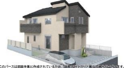
このパースは図面を基に作成されているため、実際の仕上がりとは異なる場合がございます。

住宅性能評価W取得と税制優遇の長期優良住宅・BELS評価書取得!! 耐震等級3(最高等級)の永住邸♪こだわりの仕様(折上天井・ポップアップ天井・食洗器・玄関カードキー(電池錠))