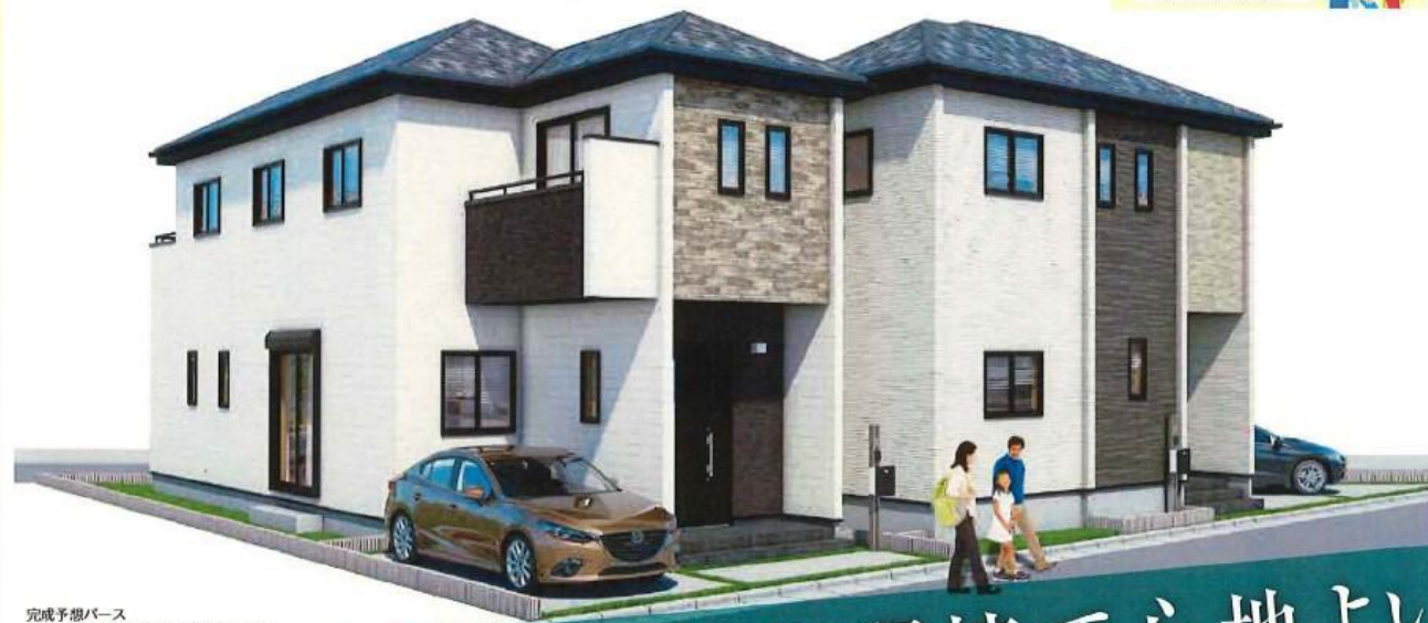
完成予想バス (実際とは多少異なることがあります)

子育て世帯・若者夫婦世帯 ※ に向けた 子育てエコホーム支援事業 【補助金対象】 ●子育て世帯：18歳未満の子を育てる世帯 ○子育て世帯：夫婦のいずれかが30歳以下で子育て ●詳しくは分譲事業説明会HPをご覧ください ●補助金により建設費の負担が軽減されます。 詳細は分譲事業説明会にてご確認ください。