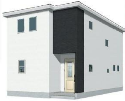
※3Dイメージ/このパースは図面を基に描いたもので実際とは多少異なる場合がございます。

物件番号 FB87-17C3 | 情報公開日 2024年06月28日 | 広告有効期限 2024年07月13日 | 仲介手数料無料+期間限定キャンペーン実施中!