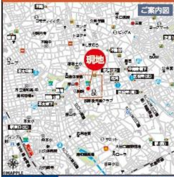
カーナビ入力 埼玉県さいたま市緑区原山2-30-4