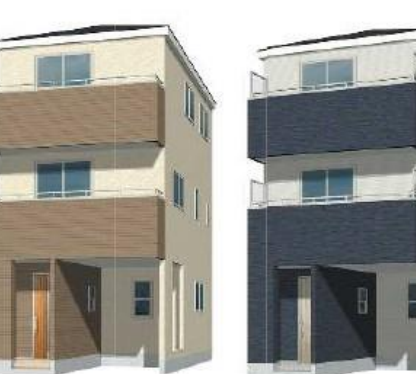
※完成予想図/このパースは図面に基いたもので実際とは多少異なる場合がございます。

物件番号 E67C-DE7C 情報公開日 2024年06月20日 広告有効期限 2024年07月05日 仲介手数料無料+期間限定キャンペーン実施中!